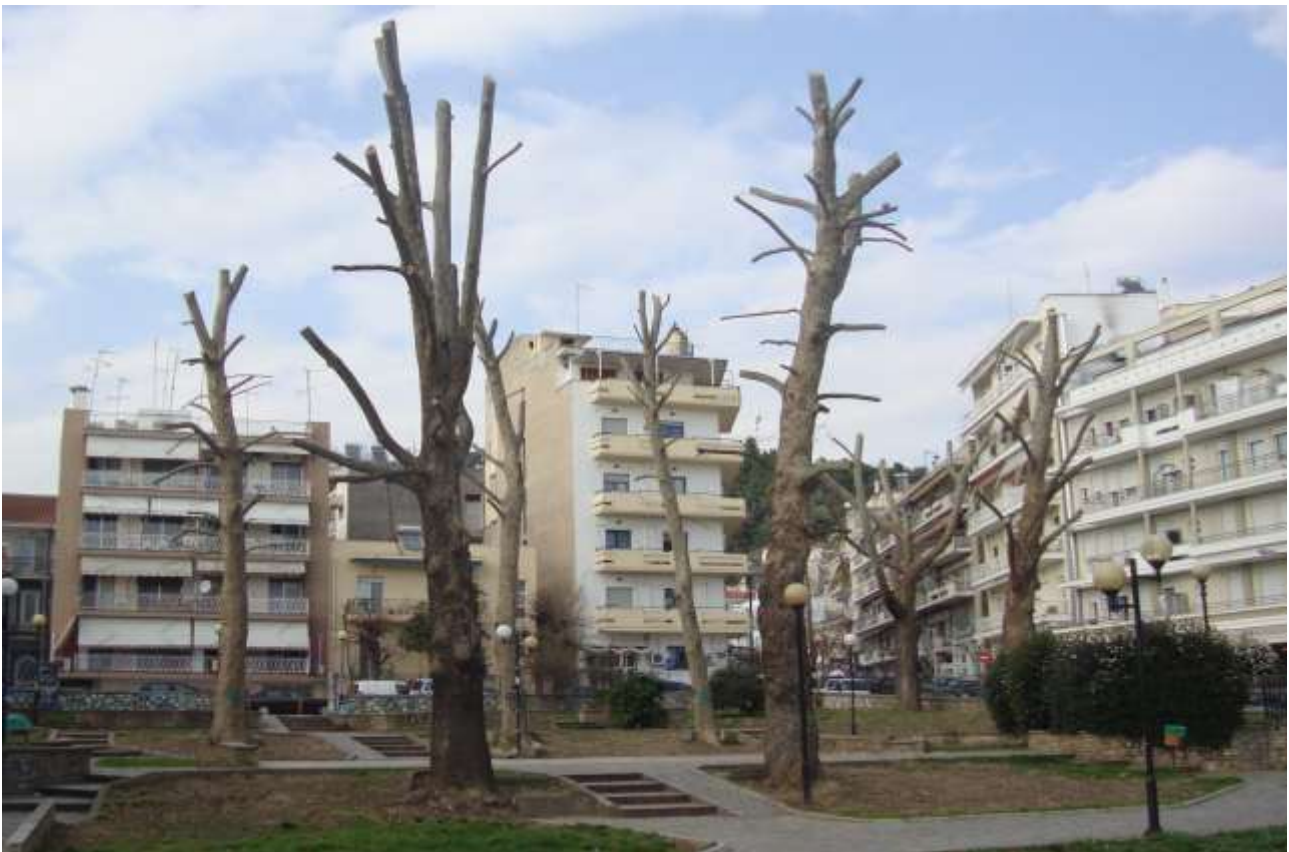
Το πάρκο ΙΚΑ στις Σέρρες μετά τις αποκλαδώσεις.

Στις παρακάτω φωτογραφίες μπορείτε να δείτε ορισμένα ενδεικτικά παραδείγματα λανθασμένων πρακτικών αποκλάδωσης δέντρων.