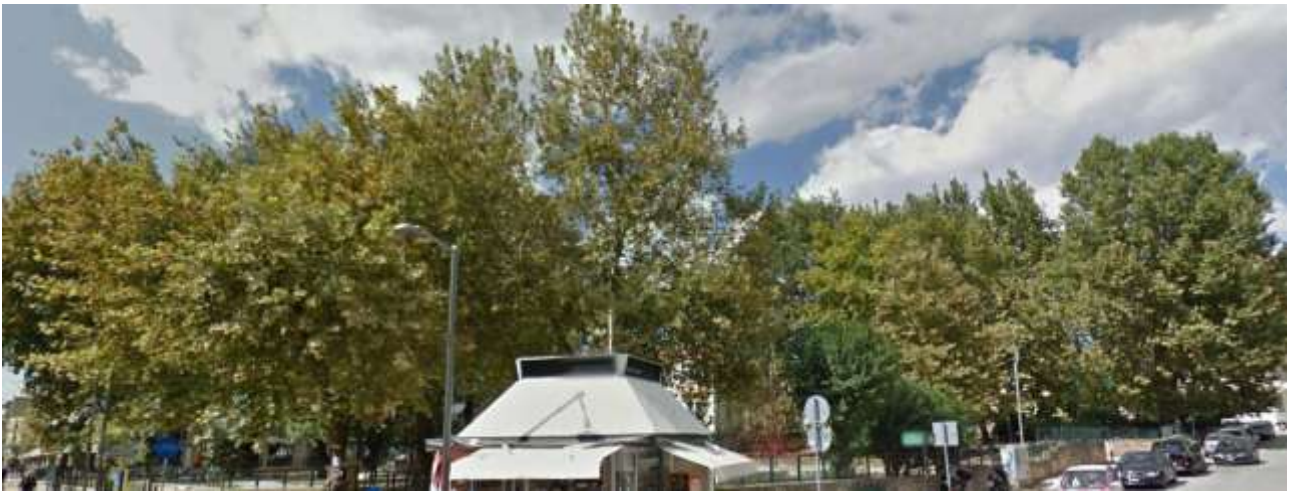
Το πάρκο ΙΚΑ στις Σέρρες πριν τις αποκλαδώσεις.