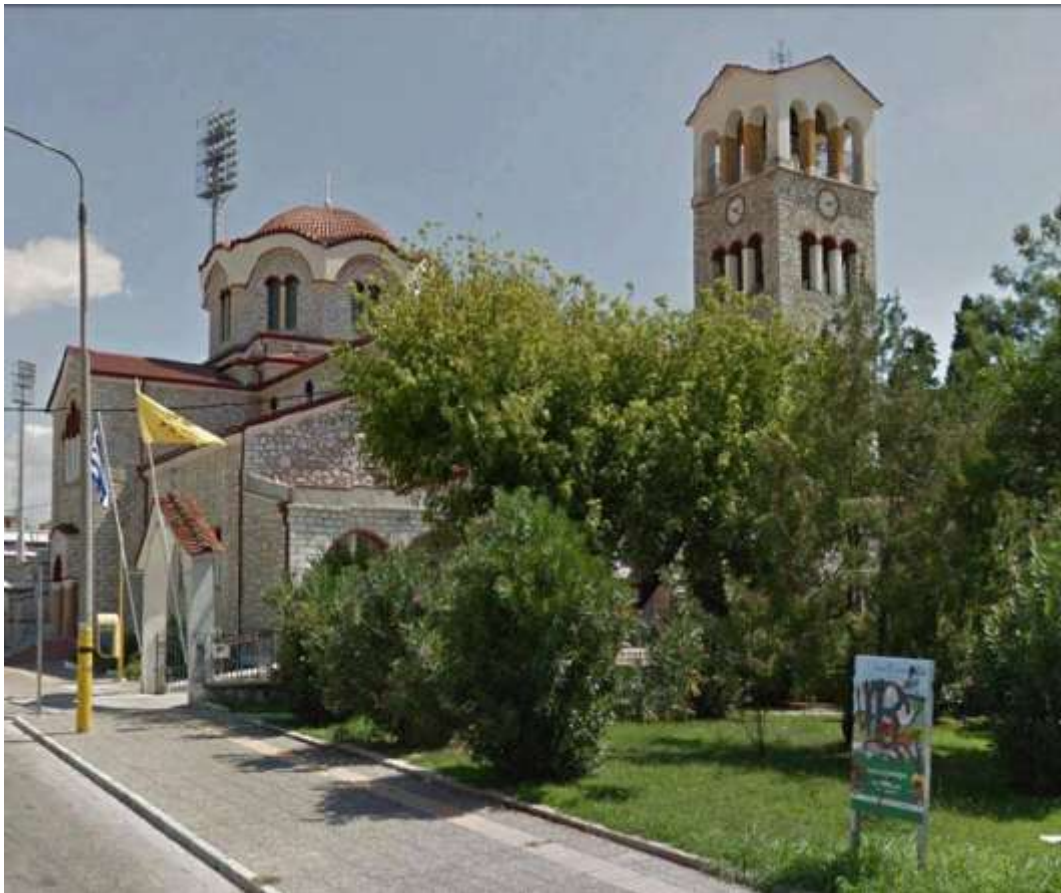
Χώρος πρασίνου στην Δράμα πριν τις αποκλαδώσεις