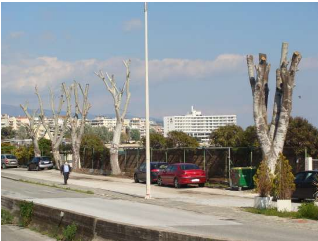
Αποκλαδώσεις δέντρων στην παραλία της Καβάλας